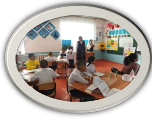
Семинарда башталгыч класстар кабинетинин ачылышын тааныштыруу учуру