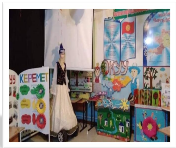
“Окуу керемет!” долбоору боюнча өтүлгөн семинардагы ачык сабактар.